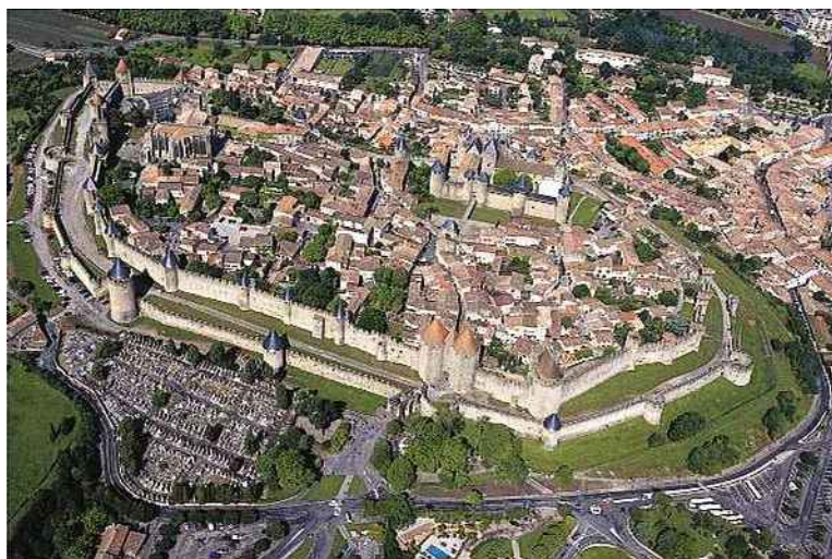
Carcassonne, la double enceinte