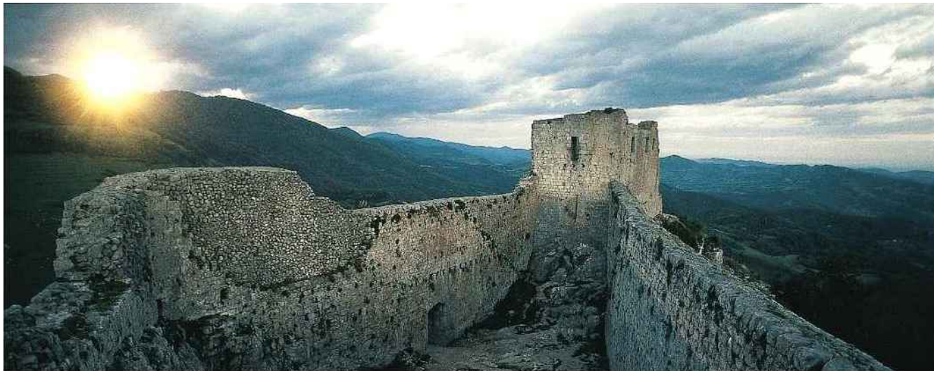
Le château de Montségur, point de départ du chemin des Bonshommes